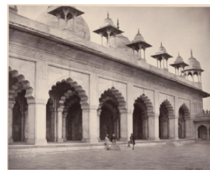
Samuel Bourne, Gezicht op de Moti Masjid in Agra [afb. 13], 1864-1866, foto, 23,2 x 29,2 cm, Rijksmuseum, Amsterdam, inv.nr. RP-F-1998-3

Ook is er te Sâncchi belangrijk reconstructie-werk verricht, dat echter bij een der kleine stûpa's veel en veel te ver is gedreven. Daar het hier echter een nagenoeg onversierde, ondergeschikte stûpa betreft, is de zonde – dooddrukken van oud door nieuw – niet zoo groot, en is het geval meer naïef dan ontstellend.