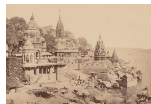
Samuel Bourne, Rituele crematie stapels op de ghats (kade) aan de Ganges te Varanasi [afb. 1], 1863-1870, foto, 23,7 x 29,4 cm, Rijksmuseum, Amsterdam, inv.nr. RP-F-00-6411-1

Het op geringen afstand van Benares gelegen Sârnâth [afb. 2] is een oord van groote beteekenis voor het Boeddhisme geweest.