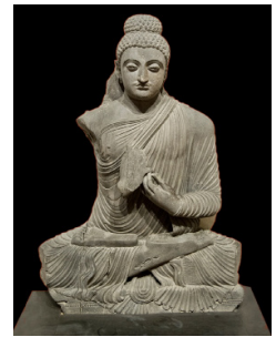
Boeddha [afb. 6], Pakistan, 4de eeuw, Indian Museum te Kolkata