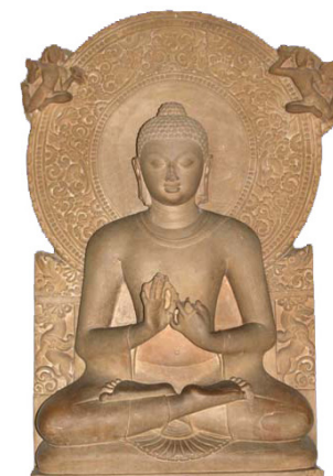
Zittende Boeddha [afb. 5], Sarnath, Gupta-periode, 5de eeuw, zandsteen, hoogte 155 cm, Sarnath Museum, inv.nr. 340