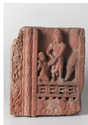
Voorbeeld van Mathura- kunst uit de collectie van de VVAK (aangekocht in 1968), Fragment van een deurpost [afb. 12], Mathura, 200- 300 n.Chr., hoogte 35 cm, Rijksmuseum, Amsterdam, bruikleen KVVAK, inv. nr. AK- MAK-1186