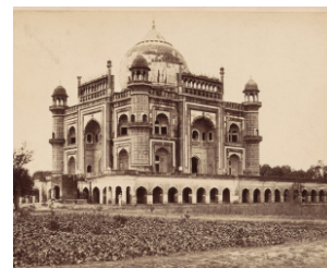
Samuel Bourne (toegeschreven aan), Mausoleum van Safdarjung [afb. 11], Delhi, 1863 - 1866, foto, 20,2 x 29,8 cm, Rijksmuseum, Amsterdam, inv.nr. RP-F-F02483

Tusschen de twee fameuze centra van Moghul'sche kunst, Delhi en Agra, ligt Muttra voor dengeen, die zijn hart aan de Indische kunst heeft verpand, als een welkome oase. In Mathurâ is een synthese ontstaan tusschen Hellenistische Gandhâra-elementen en de Indische kunst van Barhut en Sânci (zie voor Barhut mijn vorigen brief). Terwijl de Gandhâra-school haar bloeitijd vermoedelijk in de eerste eeuw nà Chr. beleefde, Barhut ongeveer uit het midden der tweede eeuw vóór Chr., en Sânci uit de eerste eeuw vóór Chr. dateert, stamt de karakteristieke beeldhouwkunst van Mathurâ, die tot de Kushân-periode (ongeveer 50-300 na Chr.) behoort, uit de tweede eeuw onzer jaartelling [afb. 12].