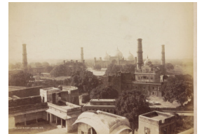
Samuel Bourne, Gezicht op de Badshahi Masjid en de Samadhi van Ranjit Singh rond Fort Lahore [afb. 7], 1863-1870, foto, 21,1 x 29,2 cm, Rijksmuseum, Amsterdam, inv.nr. RP-F-F02508