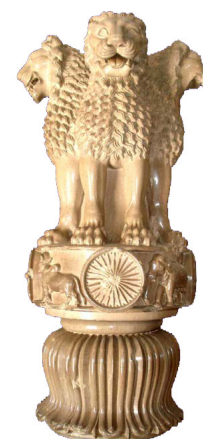
Leeuwenkapitel van Mauryan-keizer Ashoka [afb. 4], Sarnath, 3de eeuw v.Chr., 210 x 283 cm, Sarnath Museum, inv.nr. nr. 355