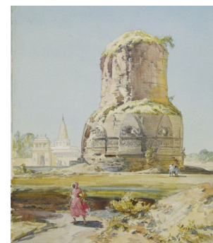
William Simpson, Boeddhiste stoepa te Sarnath, de plaats van de eerste predicatie [afb. 3], 1864, waterverf schildering, 35,5 x 25,4 cm, Victoria & Albert Museum, Londen, inv. nr. 1157-1869

Na Benares kwam het overwegend Mohamedaansche Lahore – conglomeraat van schreeuwerig Klein-Aziatische en nuchter Engelsche sfeer – aan de beurt. De stad bezit een groot, triest, en rommelig museum, dat me dunkt alleen van belang kan zijn voor fanatieke, in beeldende kunst uitsluitend Westersch georiënteerde, bewonderaars der Gandhâra-plastiek. Voor hen dus, die in deze uitingen, die Cohn volkomen terecht niet Gandhâra-Boeddhistische, doch Hellenistische, kunst noemt, het schoonste zien, dat in Indië ontstaan is.