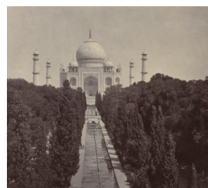
Samuel Bourne, Gezicht op de Taj Mahal en de bomen in Agra [afb. 14], 1863-1865, foto, 23,6 cm x 28,8 cm, Rijksmuseum, Amsterdam, inv.nr. RP-F-F80436