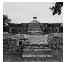
Dr. J. H. Jager Gerlings, Opgegraven resten van de stad Taxila nabij Rawalpindi [afb. 8], foto, datering onbekend, Wereldmuseum, Amsterdam, inv.nr. TM-20005920