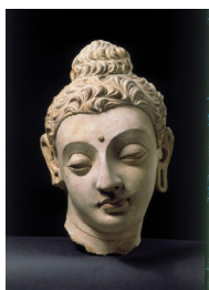
Hoofd van Boeddha [afb. 10], Gandhara-stijl, Taxila (waarschijnlijk), 4de-5de eeuw, zandsteen, hoogte 29,2 cm, Victoria & Albert Museum, Londen, inv.nr. IM.3-1931

Taxila was, evenals Peshâwar, eertijds een middelpunt van Hellenistische kunst. De kunst van Taxila is me dunkt echter gevoeliger dan die van Gandhâra, terwijl de blonde zandsteen van fijne structuur, waarover de beeldhouwers van Taxila de beschikking hebben gehad, oneindig veel schooner is dan de harde en doodsche zwart-grijze steen waaruit de bekende Gandhâra-stukken gehakt zijn [afb. 10] 5 .